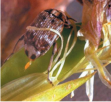
strąkowiec grochowy (owad dorosły i larwa)