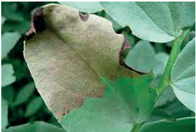
mączniak rzekomy grochu