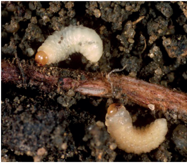
oprzędzik pręgowany owad dorosły i larwy