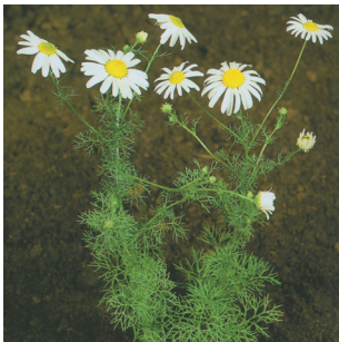
maruna nadmorska bezwonna