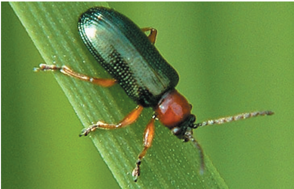
skrzypionka zbożowa (owad dorosły i larwa)