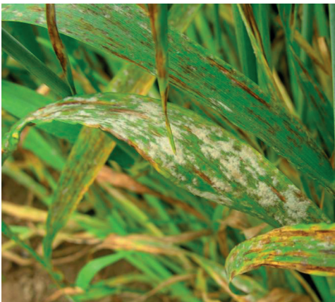
mączniak prawdziwy zbóż