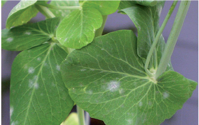
mączniak prawdziwy grochu