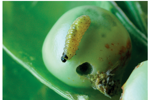
pachówka strąkóweczka owad dorosły i larwa