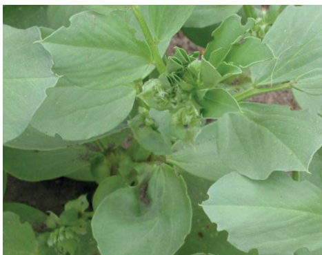
oprzędzik szary (owad dorosły i uszkodzenia)