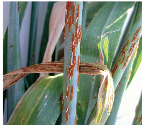
rdza źdźbowa zbóż i traw